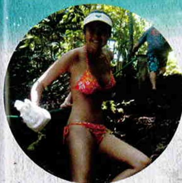
要去水母湖，必先要走十多分鐘崎嶇山路。

去到蘑菇島，當然要見見蘑菇島的國民啦！（抱歉！這裡所指的不是帛琉人，而是……「牠們」！）而蘑菇形狀的國民就是指這些水母了！ 水母湖中的水母全是無毒的。為甚麼？這是由於多年前的地殼變動，在其中一些小島中形成了一些淡水湖，而當中有不少水母就這樣被困在湖中不斷繁殖，由於湖中只有海藻作為水母的食糧，漸漸地令牠們失去毒性。 到水母湖最好選擇中午陽光普照的時候，因為水母都需要陽光來進行光合作用，幫助消化水藻，因此牠們會在陽光普照的時候浮到水面。 到達水母湖後，你首先會見到一片綠綠的湖水，當你跳進湖中，再慢慢游到湖中央，你會看見愈來愈多的水母在湖底湧上來。被這些「蘑菇國國民」熱烈歡迎，透明的「蘑菇」團團包圍，感覺……真的很像卡通片內的情節。