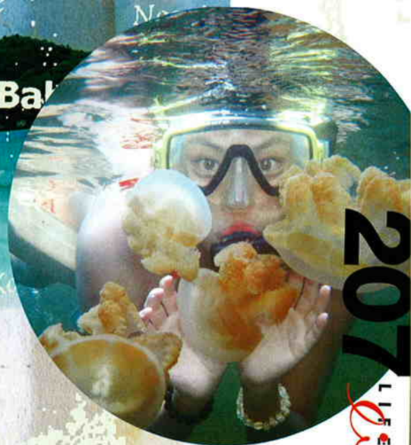
這個就是水母湖喇！小心點，可以用手摸摸牠們。