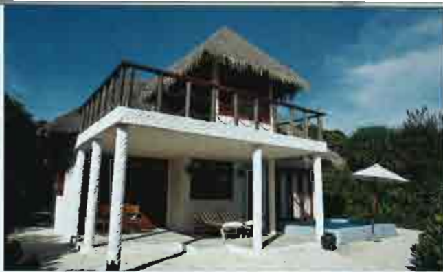
大宅被叢林重重包圍，私隱度十足。

島上的Mandira Dive潛水中心，每天早上及下午均舉辦潛水課供持有PADI證格的住客參加。水上活動中心有浮潛裝備、獨木舟、風帆等免費設備供應，另有收費的滑水、豪華摩托艇遊河、出海釣魚等活動。康樂中心內有網球室、網球及乒乓球等設備，中心外另有兩個網球場。有免費的排球及足球。此外，島上還有游泳池、兒童遊樂室、圖書館、沙灘排球。亦備有由著名的Mandira Spa提供，共有8間專人的treatment room，以專業式按摩推拿馳名，收費由3760/1.5小時起，收費合理。此spa中心備有按摩師在訂房之期間隨時訂做服務。