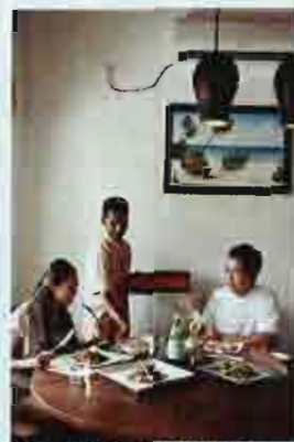
Dear Abi是我們的好幫手，照顧我們一日三餐。

忘了告訴你，這裏的管家有句口號，就是「The answer is YES. What is your question?」唔……如果你都可以跟我這樣說，那便好了！^_^