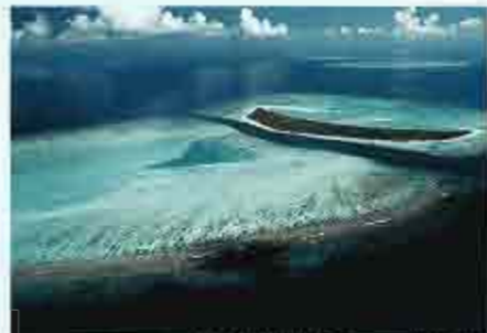
Island Hideaway就是位於原始的Dhonakulhi島上。