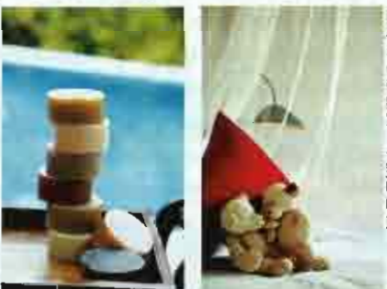
已被我們帶回家的一對哩哩熊