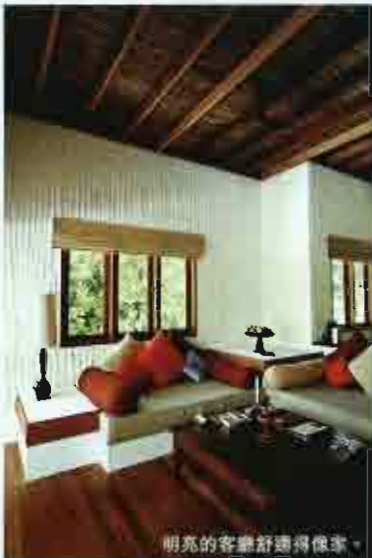
明亮的客廳舒適得像家。

全島只有40多間villa，而villa的面積更堪稱是全馬爾代夫最大的。像我們入住的The Dhonakulhi Residence，雖然只屬於6種房之中的中價級別，但面積也有近6,000呎，一座獨立villa有客廳、飯廳、睡房、衣帽間、半開放式花園浴室、閣樓露台、私家花園、涼亭、按摩泳池及私人沙灘，規模可媲美香港億億聲的豪宅。加上villa與villa之間以至少30米的樹林相隔，私隱度十足，要是我們不往外跑，幾乎還以為島上只有我們二人。