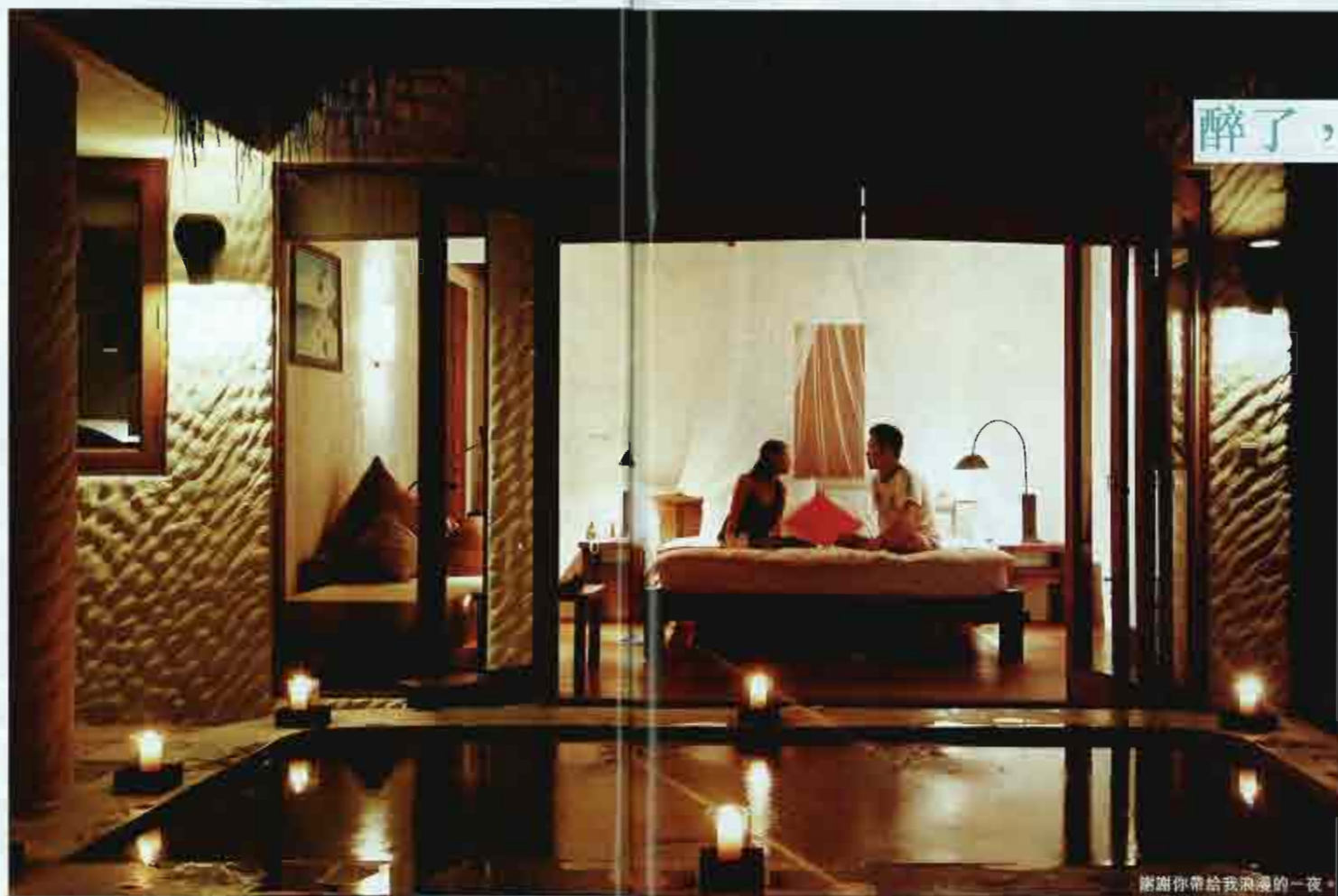
謝謝你帶給我浪漫的一夜。