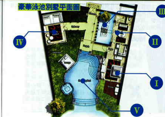
豪華泳池別墅平面圖