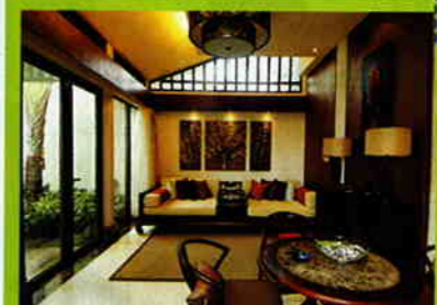
客廳內以擺放中國傳統紅木傢俬為主，甚至將圍棋當作擺設的一部分。

如果入住豪華泳池別墅，睡房的另一邊會有一棟獨立客廳，與睡房一樣有電視有冷氣。不過由於三亞天氣一年四季都好熱，由睡房往客廳要兩出兩入戶外通道，甚為不便，住宿期間都甚少進入。